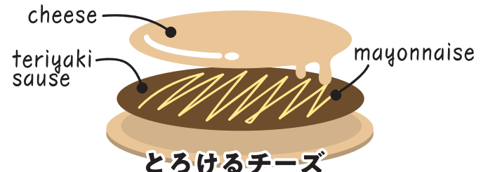
とろけるチーズ てりまヨソース teriyaki sauce & mayonnaise / cheese ★小麦/大豆/乳/卵