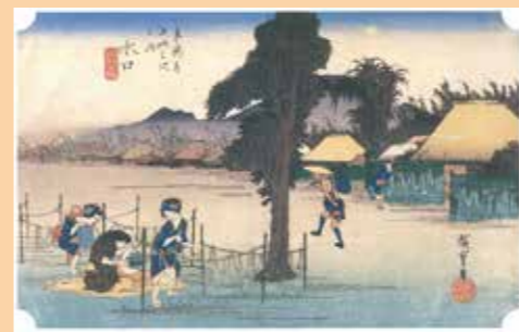
古くからの城下町 水口宿

江戸時代初期より東海道の宿場です。古城山の南の町並みは「街道一人とめ場」と言われ、現在も町内随所に点在する名所旧跡にその面影を見ることができます。