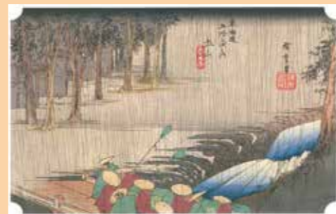
交通の要所として栄えた 土山宿

江戸時代初期より東海道の宿場です。古城山の南の町並みは「街道一人とめ場」と言われ、現在も町内随所に点在する名所旧跡にその面影を見ることができます。