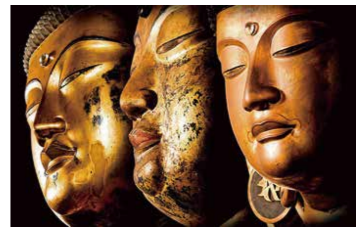
左から 釈迦如来坐像 薬師如来坐像 阿彌陀如来坐像

甲賀市は古来信仰の地として栄え、先人たちが築き上げてきた深い歴史があります。今に残る歴史遺産を訪ね歩き、忍びの里・甲賀で心と身体をリフレッシュしてみませんか。