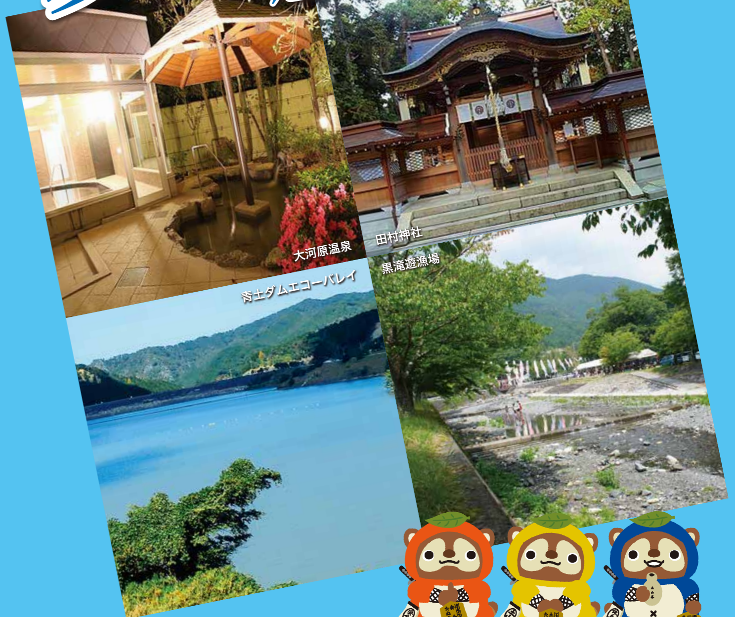
田村神社 黒滝遊漁場