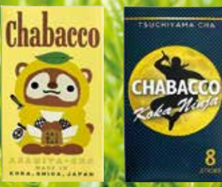
朝宮茶 土山茶 ※どちらも緑茶になります。