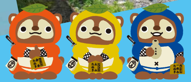
土山サービスエリアのマスコット「土山たぬき」です。ヨロシクお願いします!