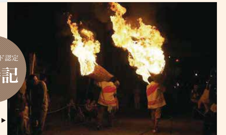
▶しがらき火まつり