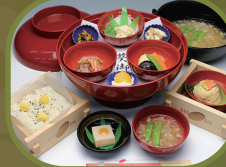
日光カステラ本舗