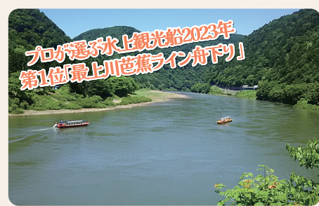
プロが選ぶ水上観光船2023年 第1位最上川芭蕉ライン舟下り!