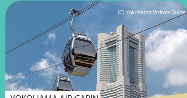
YOKOHAMA AIR CABIN 全長630m、JR桜木町駅と新港地区を結ぶ世界最先端都市型循環式ロープウェイ。