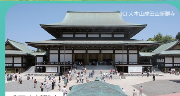
成田山新勝寺 1080年もの歴史をもち、年間百万人を超える人が訪れる全国有数の寺院。