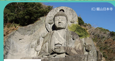
日本寺 空中にせり出したスリル満点の「地獄のぞき」や「百尺観音」で有名。