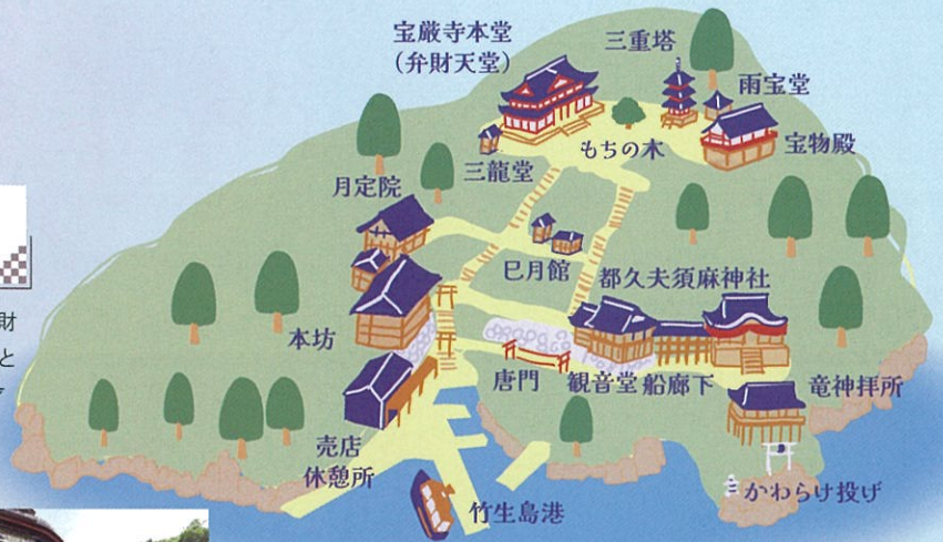
重要文化財 ふなろうか 舟廊下

重要文化財である宝厳寺渡廊は、唐門などと同様に慶長8年(1603)の建立であると考えられています。宝厳寺観音堂から都久夫須麻神社に至る幅一間の廊下で、桁行八間の低屋根と桁行二間の高屋根に分かれています。天井は垂木を見せる勾配型の化粧屋根裏で、柱間に連小窓を配します。豊臣秀吉が朝鮮出兵に使用した御座船日本丸船槽の材料を用いて建てたと言う伝承から「舟廊下」と呼ばれています。