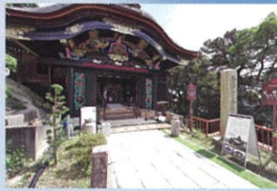
国宝 つくぶすまじんじゃ 都久夫須麻神社

豪華絢爛な桃山様式を色濃く残す貴重な遺構です。最近の調査で、豊臣秀吉が建てた幻の大阪城の極楽橋であると言われ、2020年5月に修復工事が完了。その彩色を復元いたしました。