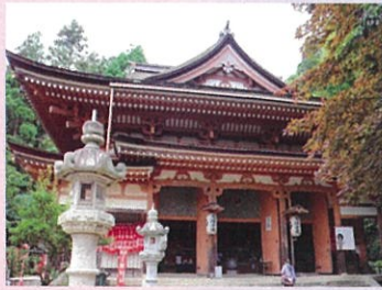
重要文化財 ほうごんじ 宝厳寺

竹生島は『神を齋く島』として古くから人々に崇められ、多くの信仰を集めてきました。 また『新緑竹生島の沈影』として琵琶湖八景の一つとして数えられています。