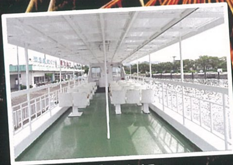
デッキから観る 花火はさらに迫力！