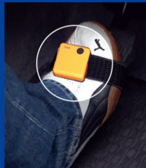
センサーモジュール