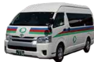
ジャンボタクシー