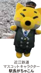
近江鉄道 マスコットキャラクター 駅長がちゃこん

滋賀県の湖東平野を走る近江鉄道は、のどかな田園風景とかつて近江商人が築き上げた伝統ある町並みを車窓から眺めることができます。滋賀県の情緒あふれる町並みや神社仏閣を巡る旅にぜひ電車をご利用ください。