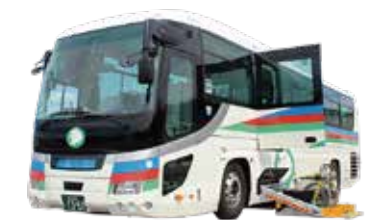
リフト付き貸切バス