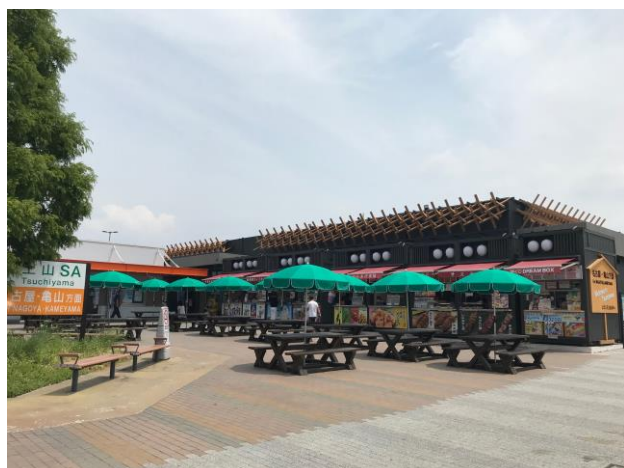
新名神高速道路土山サービスエリア（上下集約）