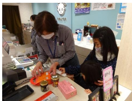
土山サービスエリア 「レジ打ち体験」の様子 (2020年12月実施)