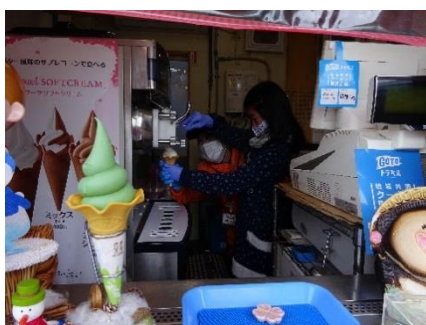
土山サービスエリア 「ソフトクリームづくり体験」の様子 (2020年12月実施)

参加費は無料で、事前予約制となっております。両サービスエリアは、一般道からもお越しいただけます。みなさまのご参加をお待ちしております。詳細は、別紙のとおりです。