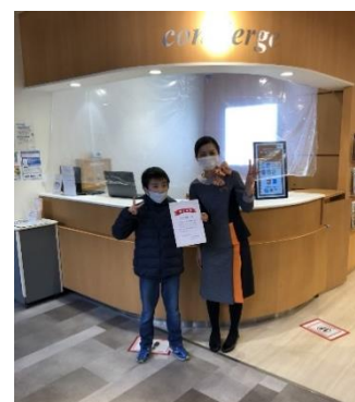
賤ヶ岳サービスエリア 「こどもアナウンス体験」の様子 (2020年12月実施)