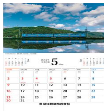
「近江鉄道カレンダー2021」5月のページ