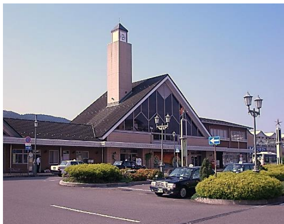
近江鉄道八日市駅