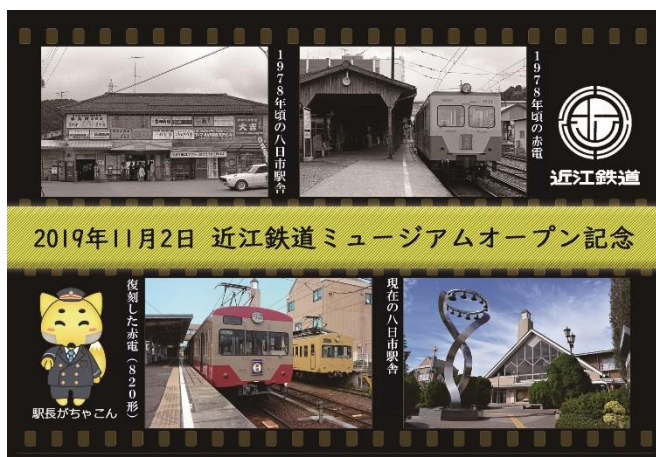
先着500名様に 「開館記念ポストカード」をプレゼント（イメージ）