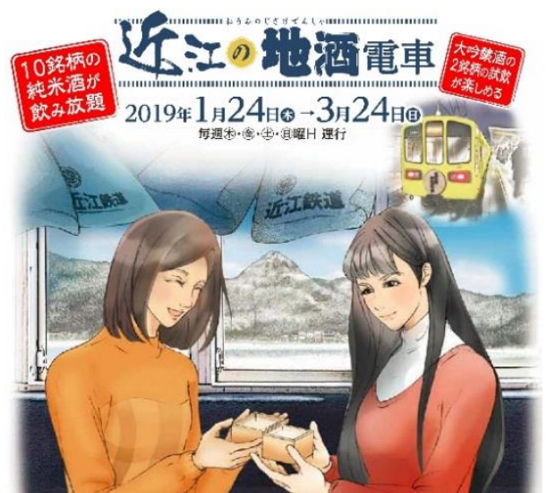
近江の地酒電車（写真は昨年の様子）