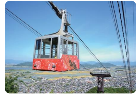
八幡山ロープウェー