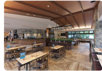
賤ヶ岳サービスエリア