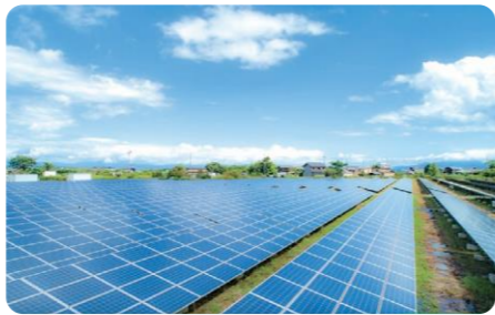
SOLAR ECO - VILLAGE あどがわ