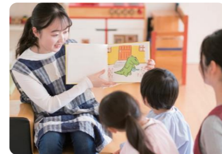
駅前保育園 ほほえみ園