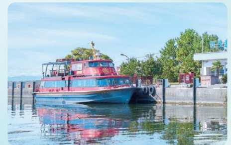
オーミマリン彦根港