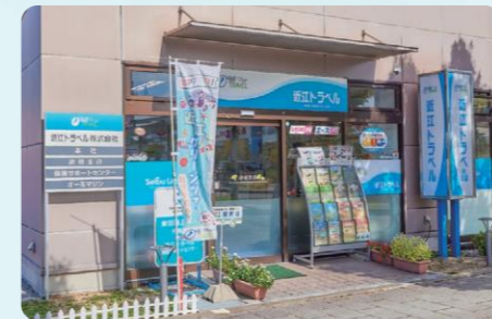
近江トラベル彦根支店

お客さまのニーズに合わせた理想の旅をプランニングいたします。観光船から見えるびわ湖は、雄大さをリアルに体感していただけます。