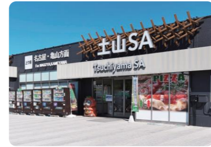
土山サービスエリア

高速道路のサービスエリア内の飲食販売運営や物品販売、ロープウェーの運行などを通じ、四季折々の自然にマッチした事業を営んでおります。