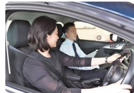
真野自動車教習所