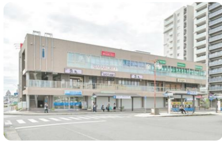
エミール近江八幡

近江鉄道グループが県内各地に保有する資産を活用して、商業施設、オフィスビル、駐車場など多岐にわたり開発を行っています。