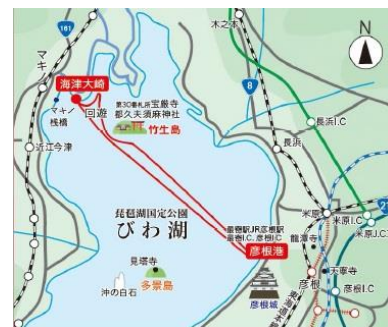
航路図（彦根港⇄海津大崎）