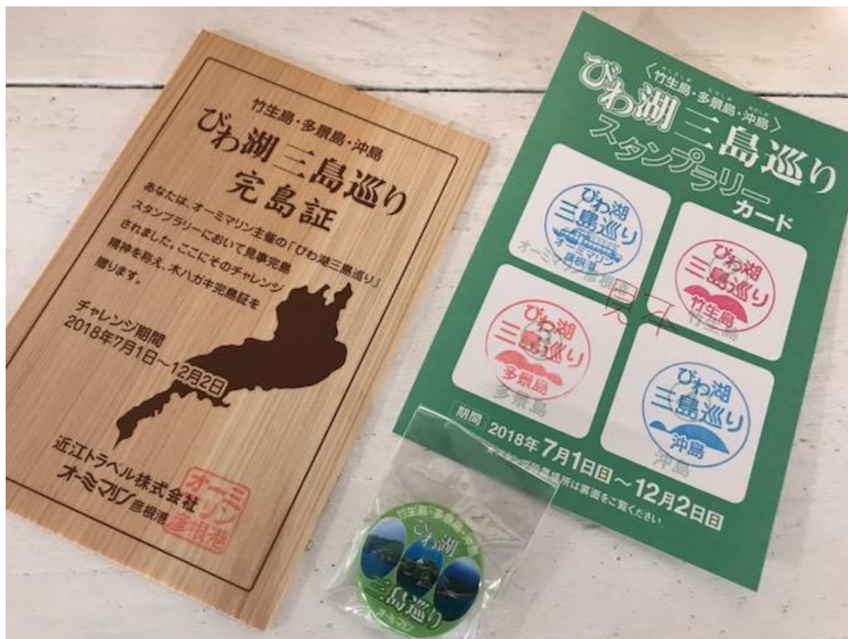
スタンプラリーカードと“木ハガキ完島証” “オリジナル缶バッジ”