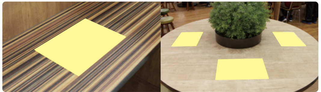
テーブルステッカー広告 ◎A4サイズ (50枚) 250,000円(月額) ◎A5サイズ (50枚) 175,000円(月額)