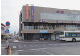
近江八幡駅前商業施設外観