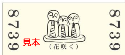
「～合格祈願～ 上り(のぼり)/城址(じょうし) 記念券」