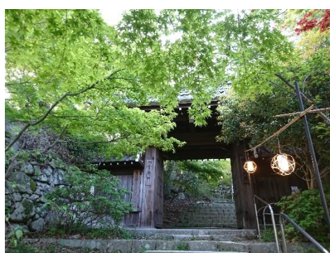
八幡山山頂の新緑