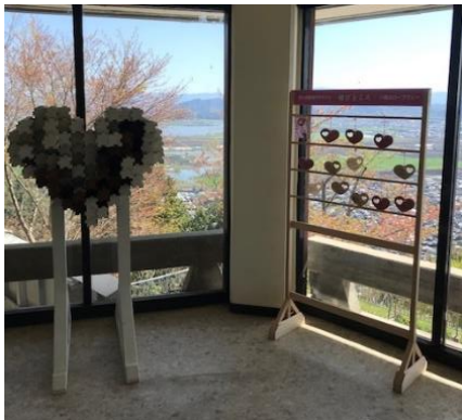
山頂の展望館2階にある「結所」

八幡山は全国のプロポーズにふさわしいロマンチックな場所「恋人の聖地サテライト」に認定されていて、山麓売店では「ハート絵馬」(1個990円)を販売しており、八幡山山頂の展望館2階には専用の結所を設置しております。