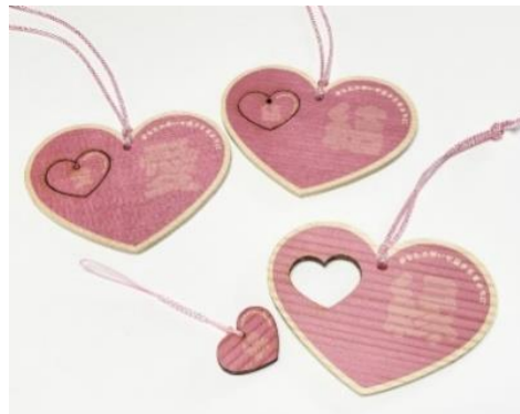
山麓売店で販売している「ハート絵馬」