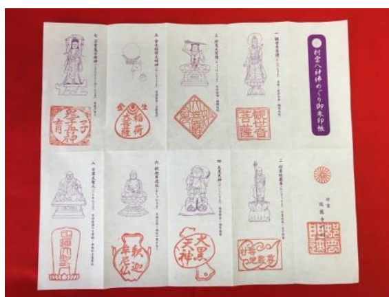
「村雲八神佛めぐり御朱印帳」

村雲御所瑞龍寺門跡の本堂内6ヵ所※にある村雲八神佛をお参り頂きながら、御朱印を押印していただけます。