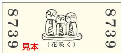
「～合格祈願～ 上り(のぼり)/城址(じょうし) 記念券」