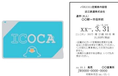
<バス ICOCA 定期券内容控>