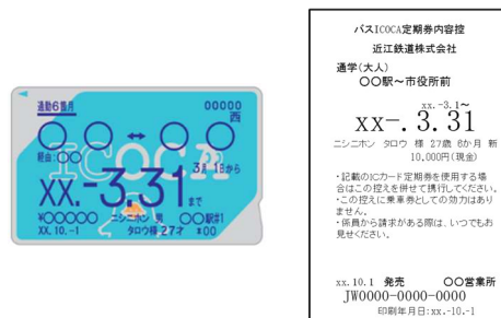
<バス ICOCA 定期券内容控>