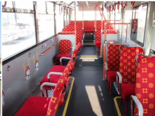
「彦根ご城下巡回バス」