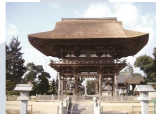
苗村神社(なむらじんじや)