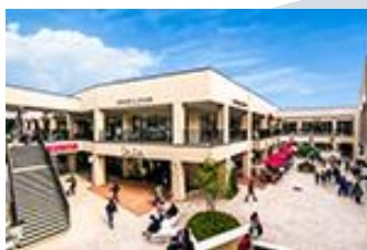
三井アウトレットパーク 滋賀竜王