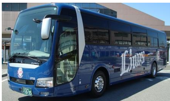
運行に使用する西武ライオンズカラー 「レジェンドブルー」のバス車両