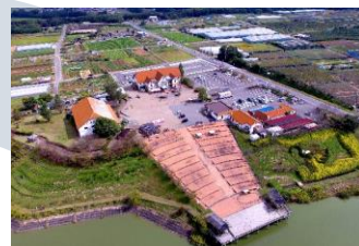
道の駅アグリパーク竜王