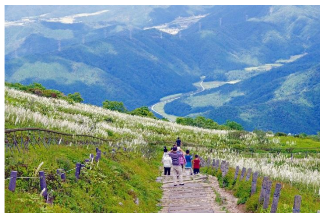
伊吹山中央登山道の風景