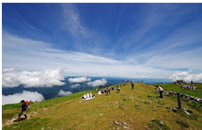
伊吹山山頂の風景

この機会に「伊吹山登山バス」を利用して健康づくりをしながら、夏を満喫してみませんか。 詳細は別紙のとおりです。