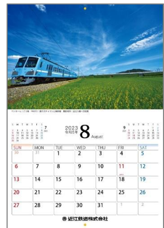
昨年発売した「近江鉄道カレンダー2023」