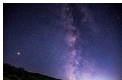
伊吹山山頂駐車場で観測の様子