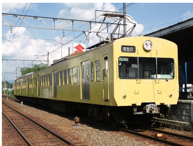
現役時代の821号（2011年撮影）