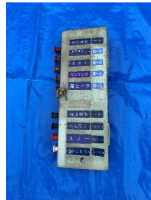
運転台引きスイッチ