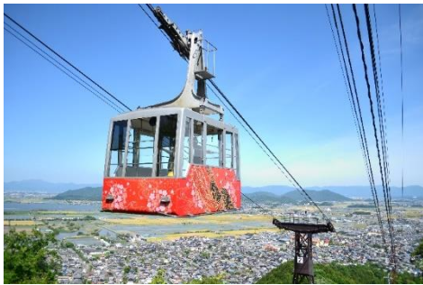
八幡山ロープウェイ

ぜひこの機会にご家族でお越し頂き、八幡山山頂から見渡せる大パノラマの景色をお楽しみください！ 詳細は、別紙のとおりです。