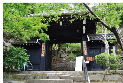
村雲御所瑞龍寺門跡