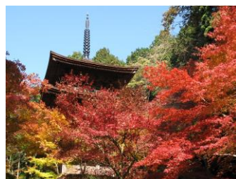
～湖東三山～ 金剛輪寺