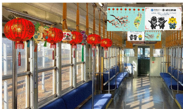
台湾風装飾電車（イメージ）