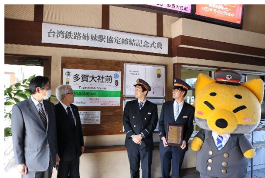
姉妹駅協定締結記念式典の様子（多賀大社前駅） 2020年11月4日

多賀大社は古くから「お多賀さん」の名で親しまれる滋賀県第一の大社です。この歴史ある場所の拠点となる駅同士の交流を通じて、友好関係を深めてまいります。