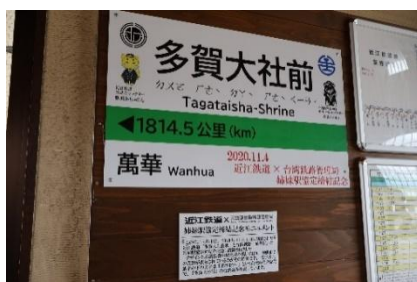
多賀大社前駅の駅名標型モニュメント