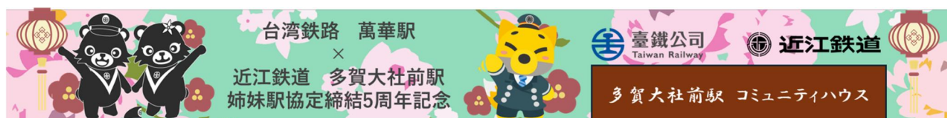
多賀大社前駅舎入口 協定締結 5 周年記念幕（イメージ）