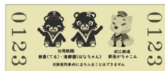
近江鉄道ミュージアム記念入場券