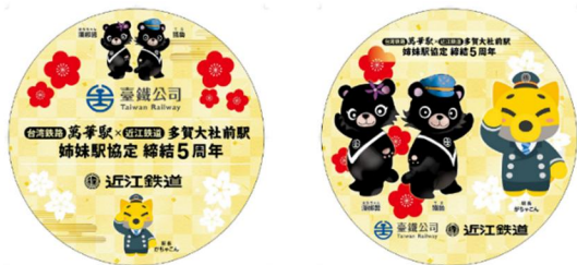
姉妹駅協定締結 5 周年記念 コラボヘッドマーク