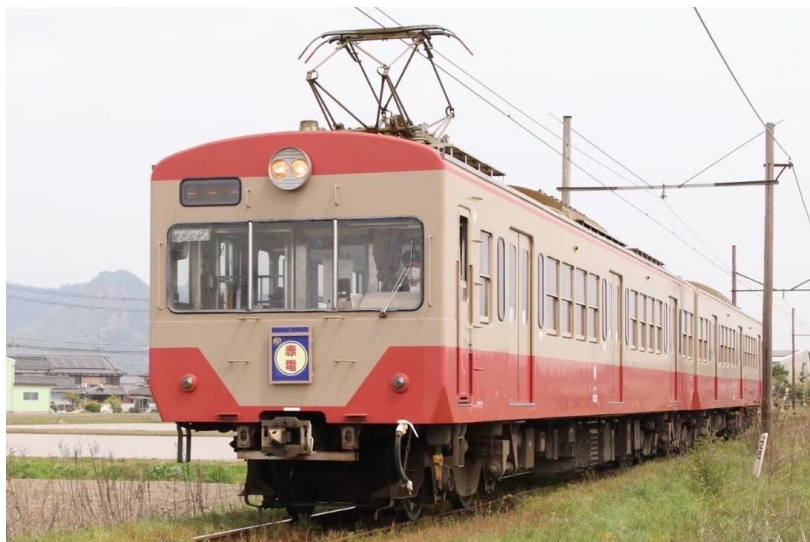
ツアーで使用する800形822号「赤電」