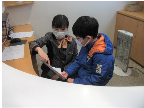
「サービスエリアコンシェルジュ アナウンス体験」の様子

当日は、サービスエリア内にあるコンシェルジュカウンターで、お客さまの接客・ご案内をするエリア・コンシェルジュと一緒に土産売店やフードコートのおすすめ商品を紹介するアナウンスに挑戦していただきます。