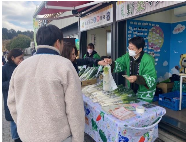
昨年開催した試食販売の様子