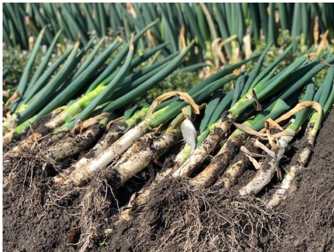
JA こうかオリジナルブランド野菜「忍葱（しのぶねぎ）」