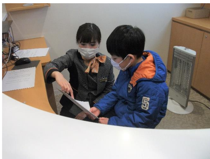
「サービスエリアコンシェルジュ アナウンス体験」の様子