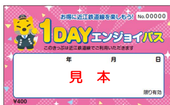
紙券フリーきっぷ「1DAYエンジョイパス」見本

https://www.ohmitetudo.co.jp/railway/ride/station/