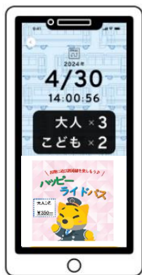
デジタルフリーきっぷ「ハッピーライドパス」 画面イメージ