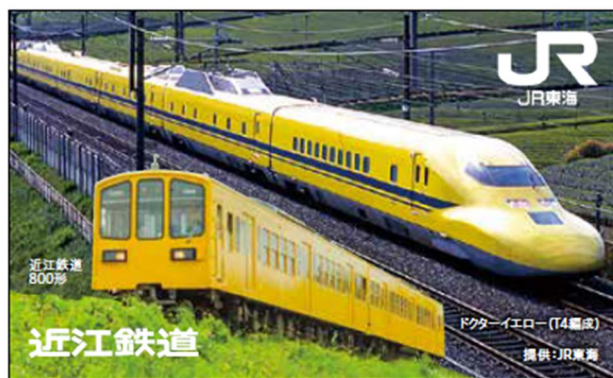
限定デザイン乗車券 表面（イメージ）