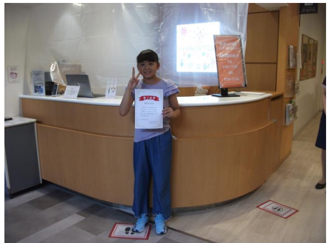
アナウンス体験の様子