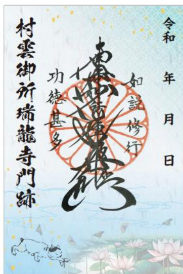
御朱印完成イメージ