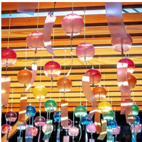
風鈴設置イメージ

この夏は、涼やかな音色が広がる八幡山を散策してみたいはいかがでしょうか。 詳細は、別紙のとおりです。