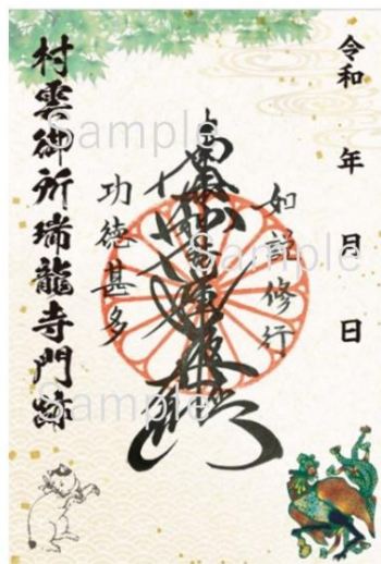
御朱印完成イメージ