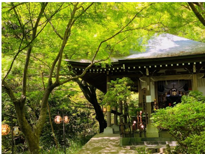
八幡山山頂の新緑