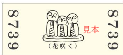
「～合格祈願～ 上り(のぼり)/城址(じょうし) 記念券」