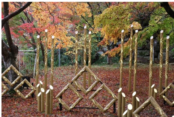
竹あかり（昨年の様子）