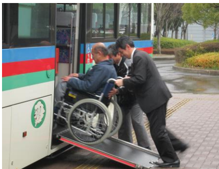
交通バリアフリー研修(滋賀県バス協会主催)の様子