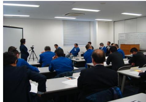
外部講師による接遇研修の様子