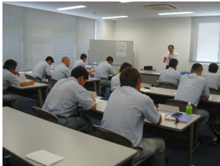
乗務員研修の様子