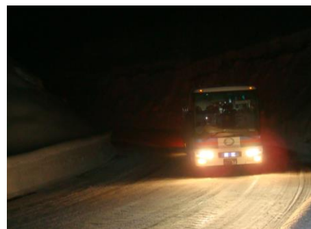
冬期雪上訓練の様子