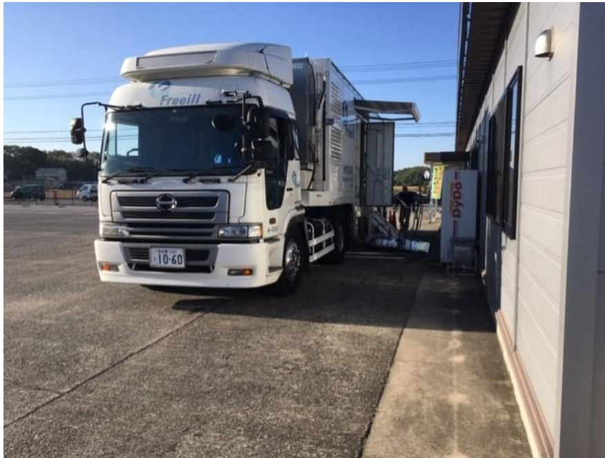
脳MRI検査のバス(湖国バス彦根営業所)

バス、タクシー、船舶の運転職を対象に、脳MRI検査（5年に1回）、睡眠時無呼吸症候群（SAS）検査（年1回）を実施しています。これにより、心脳血管疾患やSASなど健康起因の事故の未然防止に努めています。また、健康診断では、全員に眼底検査（年1回）と両眼測定（年2回）を実施し、異常の早期発見に繋がっています。