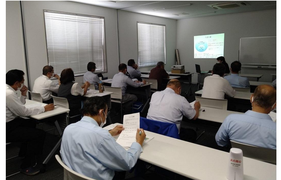
禁煙支援講座の様子