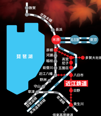
永源寺 神仏堂場 140 滋賀八番