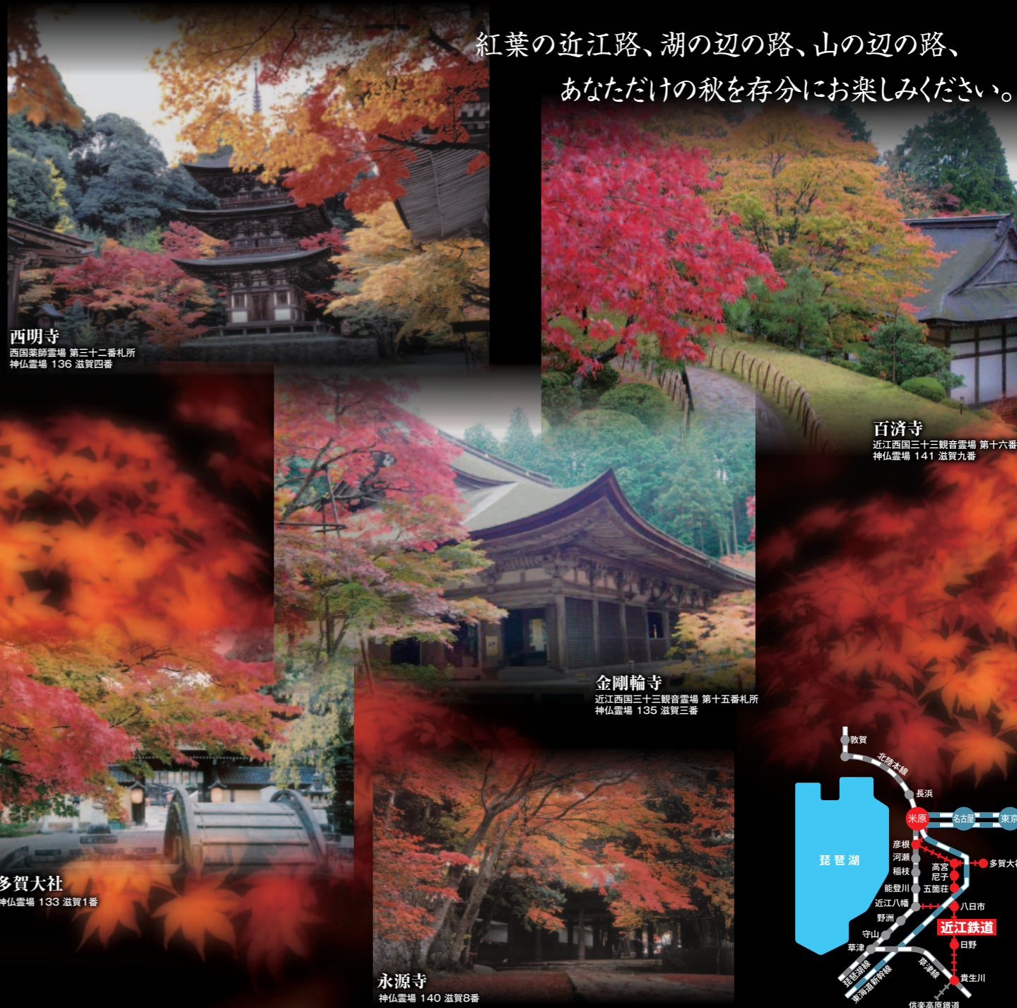
西明寺 西国薬師堂場 第三十二番札所 神仏堂場 136 滋賀四番

紅葉の近江路、湖の辺の路、山の辺の路、 あなただけの秋を存分にお楽しみください。