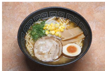
特製みそラーメン