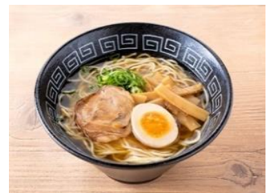
黄金しょうゆラーメン