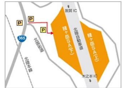
賤ヶ岳 SA（下り線）は一般道からご利用いただけます

http://www.ohmitetudo.co.jp/sa/shizugatake/