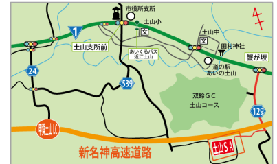
土山 SA は一般道からご利用いただけます

http://www.ohmitetudo.co.jp/sa/tsuchiyama/index.html/