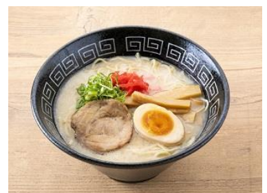
濃厚とんこつラーメン