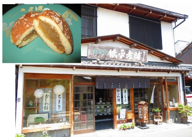
御菓子司「紙平老舗」と和菓子「むらくも殿」